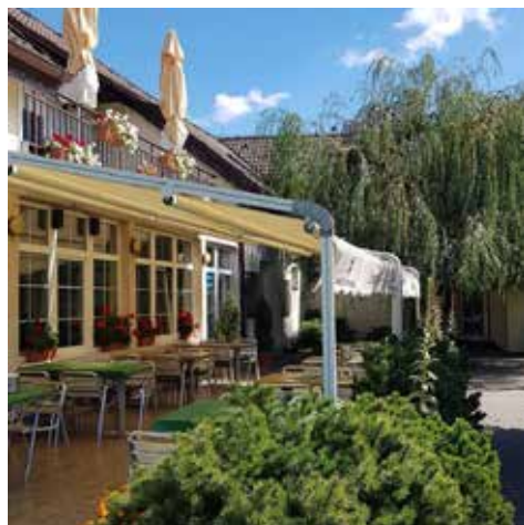
Máme po prázdninách, podzim se blíží, užijte si terasu U Drahušky dokud to jde.