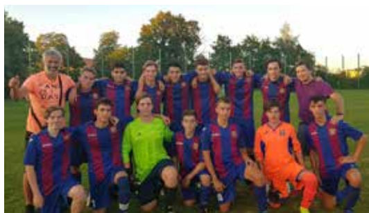
Starší dorostenci Kopaniny porazili v 1. kole poháru Řepy 14:0 a v dalším kole je čeká Zličín.

Posvícenský speciál byl famózní a je dopit. Únětické pivo však stále na čepu U Drahušky