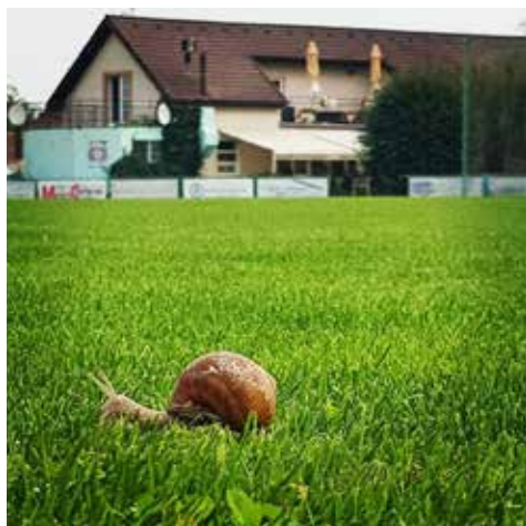
Zkoušíme nového útočníka, zatím má trochu problém s rychlostí 😊