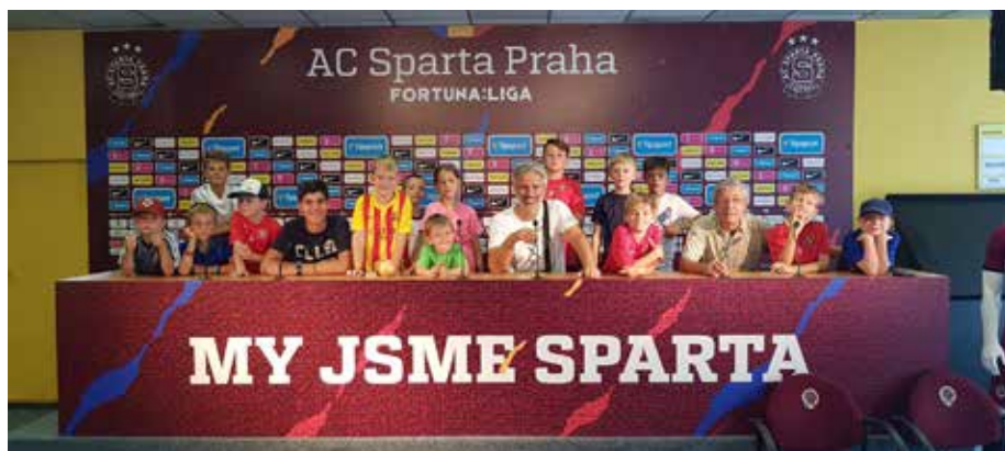
Fotbalisté Přední Kopaniny na návštěvě stadiónu AC Sparta Praha.