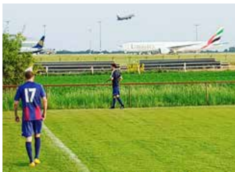
Přes léto A mužstvo trénovalo a hrálo v Kněževsi. Domácí trávník odpočíval po prořezu a dosetí

Mezinárodní zápas rezervy proti americkému výběru Concordia College skončil těsnou prohrou 2:3. Hráno v Dobrovízi