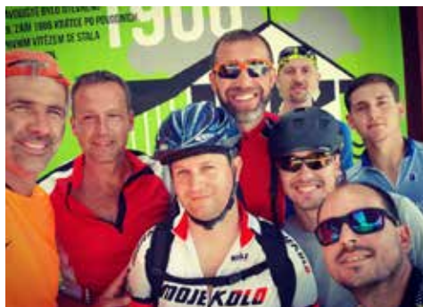
Hráči běčka a Pardálů vyrazili na soustředění do Zduchovic z Prahy na kole – 70 km