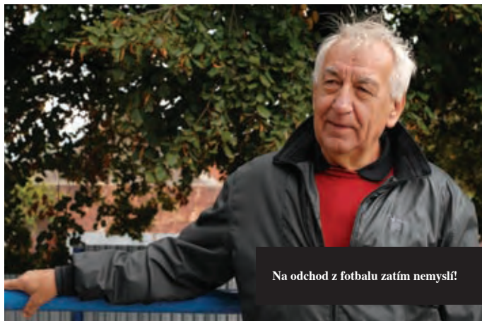
Na odchod z fotbalu zatím nemyslí.

dvou tisíc lidí. Diváci vás dovedou vyhecovat, to je velký motor.“