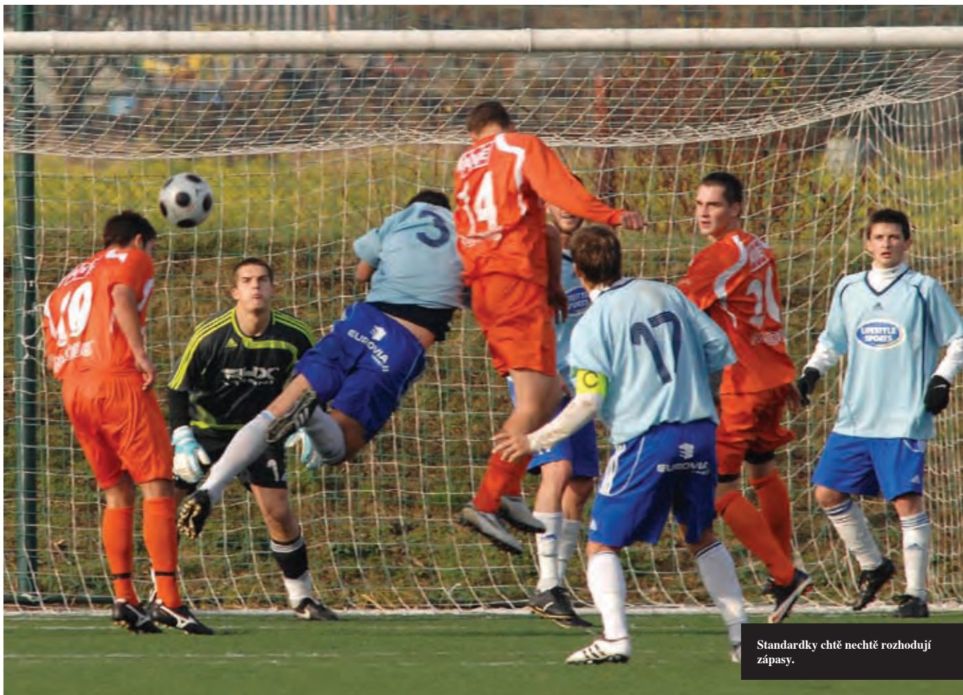
Standardky chtě nechtě rozhodují zápasy.

prosadit se proti hráčům, kteří modelově brání stejně jako soupeř, který váš tým čeká o víkendu.