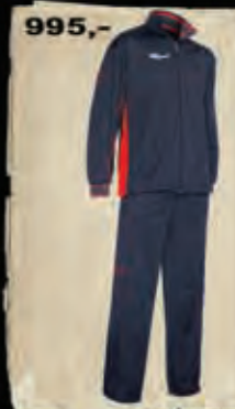
BANT - 48