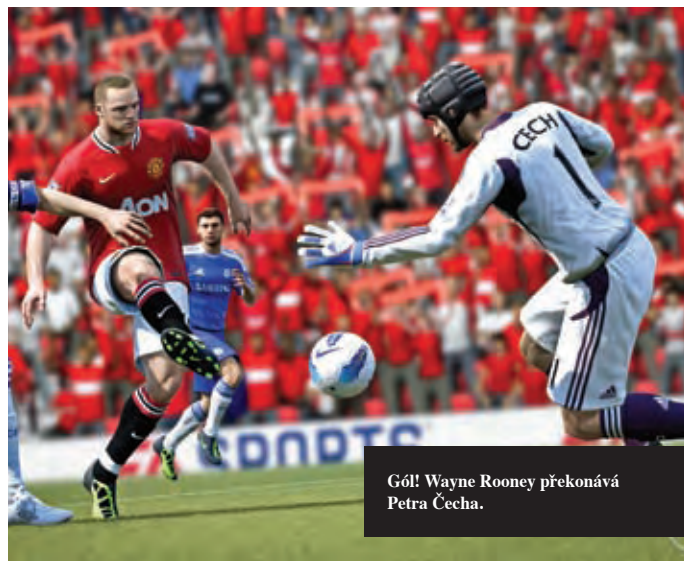
Gól! Wayne Rooney překonává Petra Čecha.

Opomenout nelze ani manažerskou stránku hry. Jako správný vůdce vezmete pod svá křídla jeden z nabízených klubů a pustíte se nejen do hraní zápasů, ale také do agendy managementu klubu. Staráte se o příchody a odchody hráčů, přičemž žádný přestup nebude jednoduchý. Kromě přestupové částky se musíte domluvit s hráčem na délce a hodnotě smlouvy, a pokud s podmínkami nebude souhlasit, tak vám s úctou zamává a váš klub odmítne. Rozhodně nečekejte, že například do Fulhamu přivedete hned druhý den Lionela Messiho. Všechno je navíc doprovázeno spekulativními novinovými články v menu hry. K dispozici budete mít i týmovou mládežnickou akademii, ze které budete sbírat mladé a nadějné talenty. Kdo ví, jaká budoucí hvězda se může z některého hráče vyklubat?