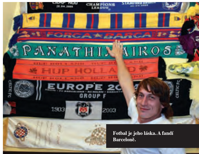
Fotbal je jeho láska. A fandí Barceloně.