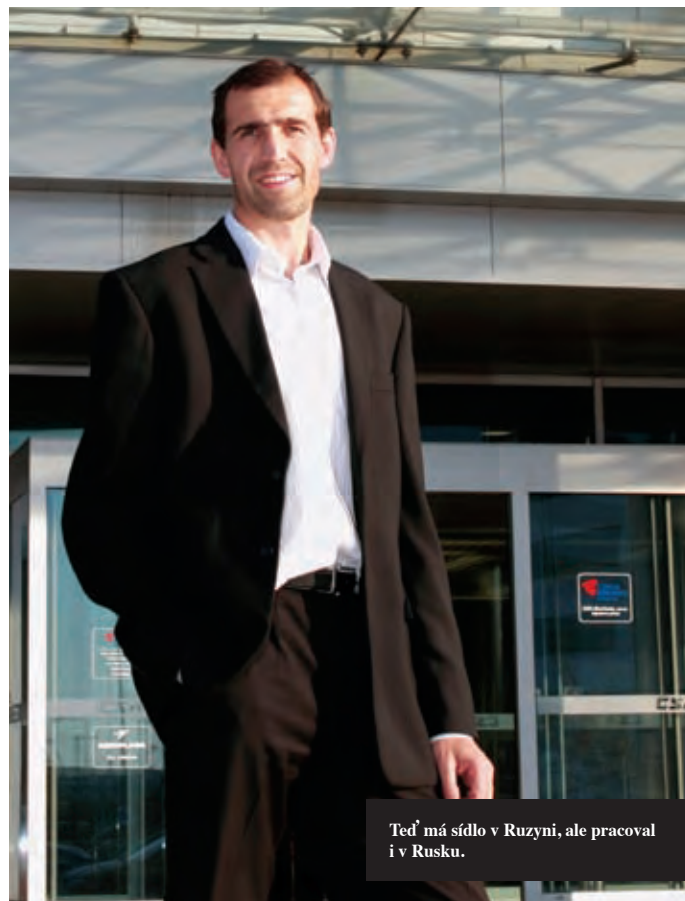
Ted' má sídlo v Ruzyni, ale pracoval i v Rusku.