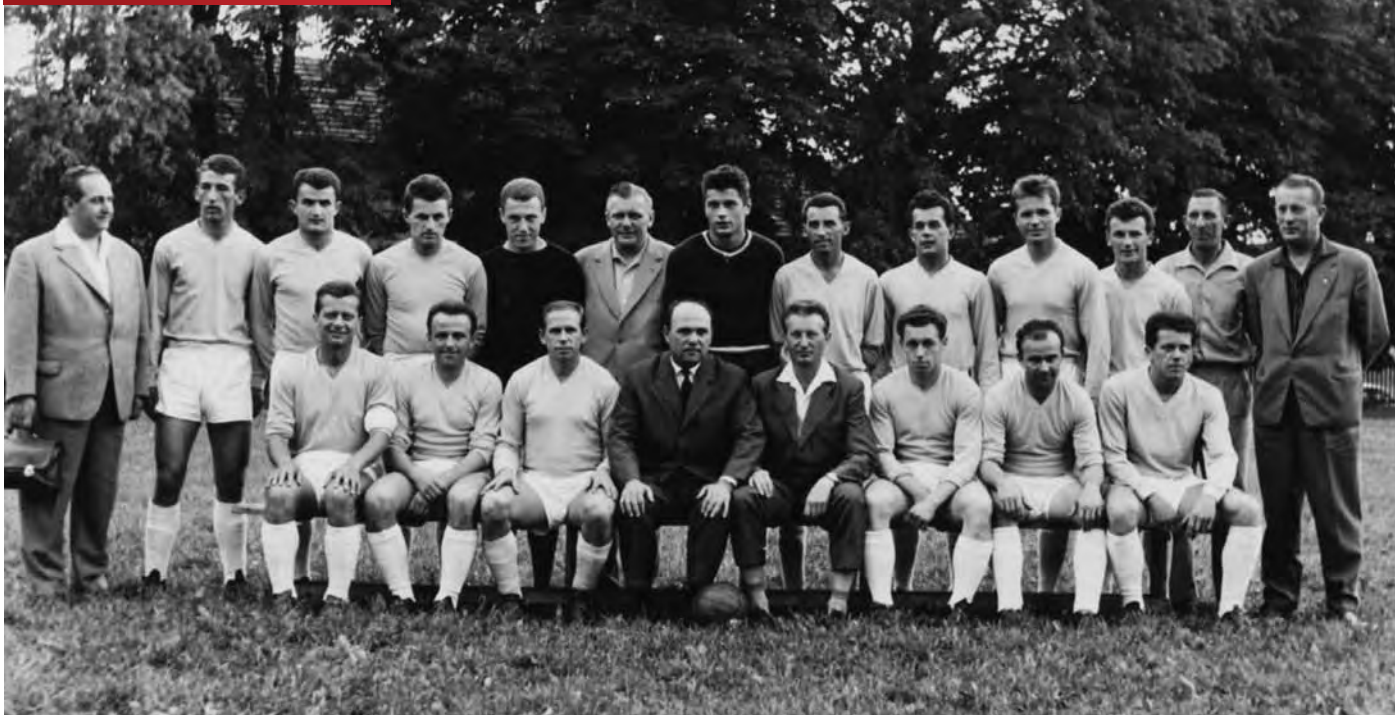
Druhý zleva (stojící) coby hráč.