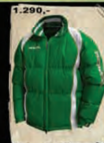
SPARTA - 103