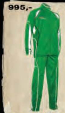
ROXE - 103