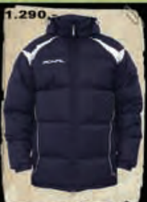
FLAMER - 43