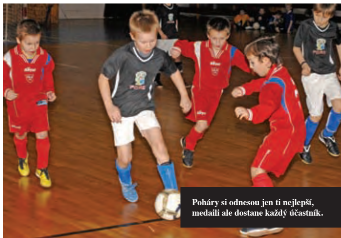
Poháry si odnesou jen ti nejlepší, medaili ale dostane každý účastník.

Odměnou za účast jsou pochopitelně poháry pro nejlepší týmy za umístění, jimiž se škola může posléze chlubit, nicméně ještě zajímavějším zpestřením je fakt, že medaili za účast obdrží každý hráč. „Je opravdu zážitek vidět šťastné děti s medailí na krku, i když třeba nevyhrály ani zápas. I v tom je smysl celé akce,“ usmívá se Srba a věří, že druhý ročník bude mít podobně pozitivní ohlas jako ten premiérový. Tak neváhejte a kontaktujte Pražský fotbalový svaz, ať jste zástupcem škol nebo klubů... ■