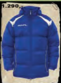
FLAMER - 93