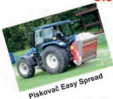
Pískovač Easy Spread

Odborná údržba umělých trávníků. Čištění, dekomprese a doplňování granulátu. Sportovní stavby na klíč.