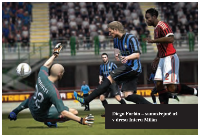
Diego Forlán – samozřejmě už v dresu Interu Milán

obraně. A nejen to! Forma či zranění se také automaticky přenášejí do hry, a pokud je třeba kanonýr Wayne Rooney hodně z formy anebo si Xavi zlomí nohu, během chvíle to poznáte i ve FIFA12.