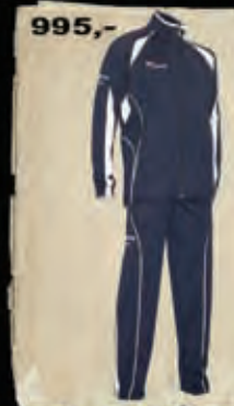
ROXE - 43

OSTATNÍ BAREVNÉ KOMBINACE NAJDETE NA WWW.DVSPORT.CZ