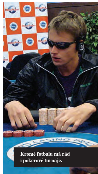
Kromě fotbalu má rád i pokerové turnaje.