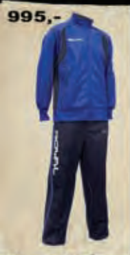
ADHARA - 49

NOVÉ MODELY VYCHÁZKOVÝCH / REPREZENTAČNÍCH SOUPRAV A ZIMNÍCH BUND