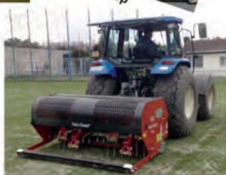
Verti - Drain

Finančně výhodná varianta rekonstrukce!!!!