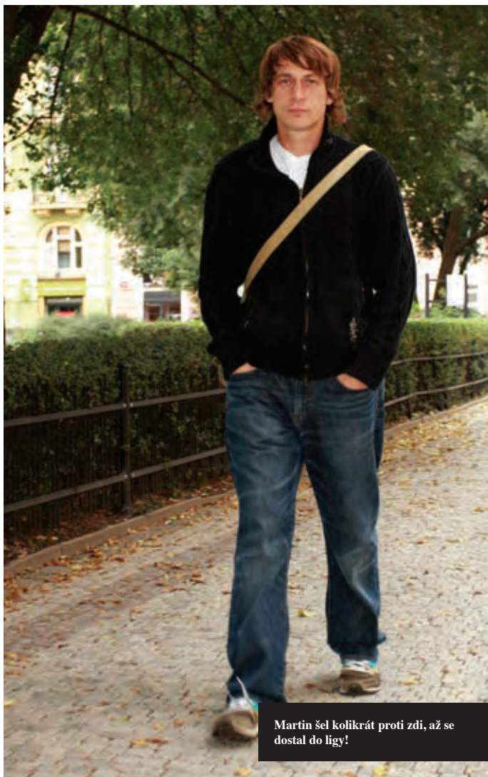
Martin šel kolikrát proti zdi, až se dostal do ligy!