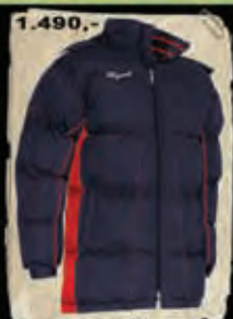
BANT - 48