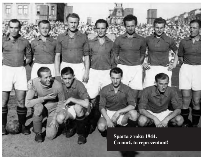
Sparta z roku 1944. Co muž, to reprezentant!

Nebyla však divize jako divize, ta středočeská měla výsadní postavení, byla jakousi neoficiální II. ligou – co do výkonnosti mužstev i hráčů docela jistě. Až v závěru její slavné éry ji začala trochu šlapat na paty Morava a po osvobození i Slovensko. Začínaly nové časy. Ale úspěchané „rozpuštění“ středočeské soutěže v roce 1948 připomínalo vylití vaničky i s dítětem... ■