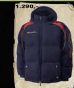
COHEN - 48

OSTATNÍ BAREVNÉ KOMBINACE NAJDETE NA WWW.DVSPORT.CZ