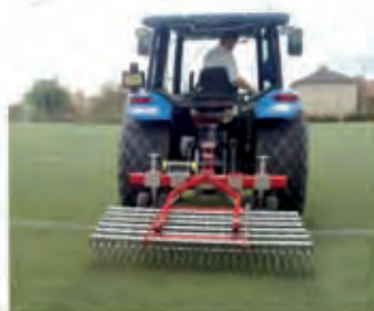
Verti - Rake