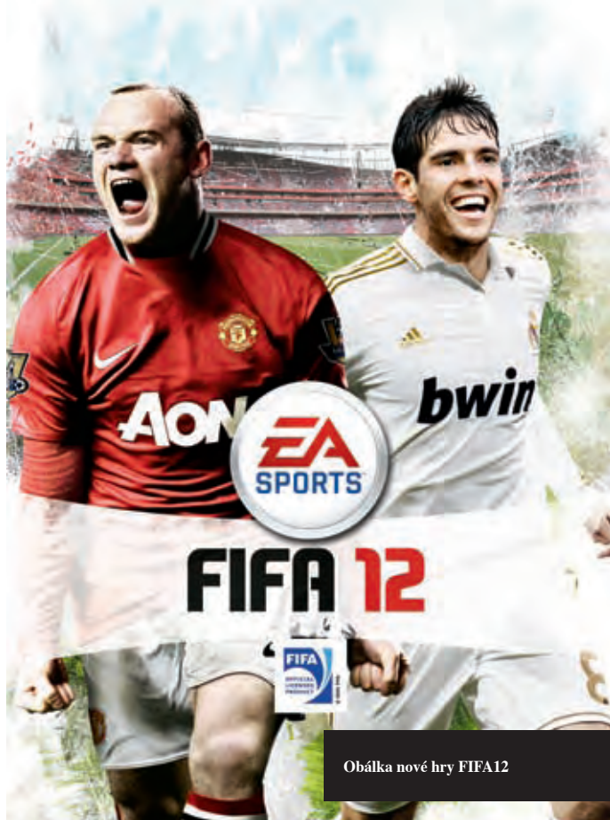
Obálka nové hry FIFA12