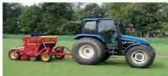
Rapid Turf 200

Zajišťujeme pokládku travních koberců a realizaci kompletních zavlažovacích systémů.