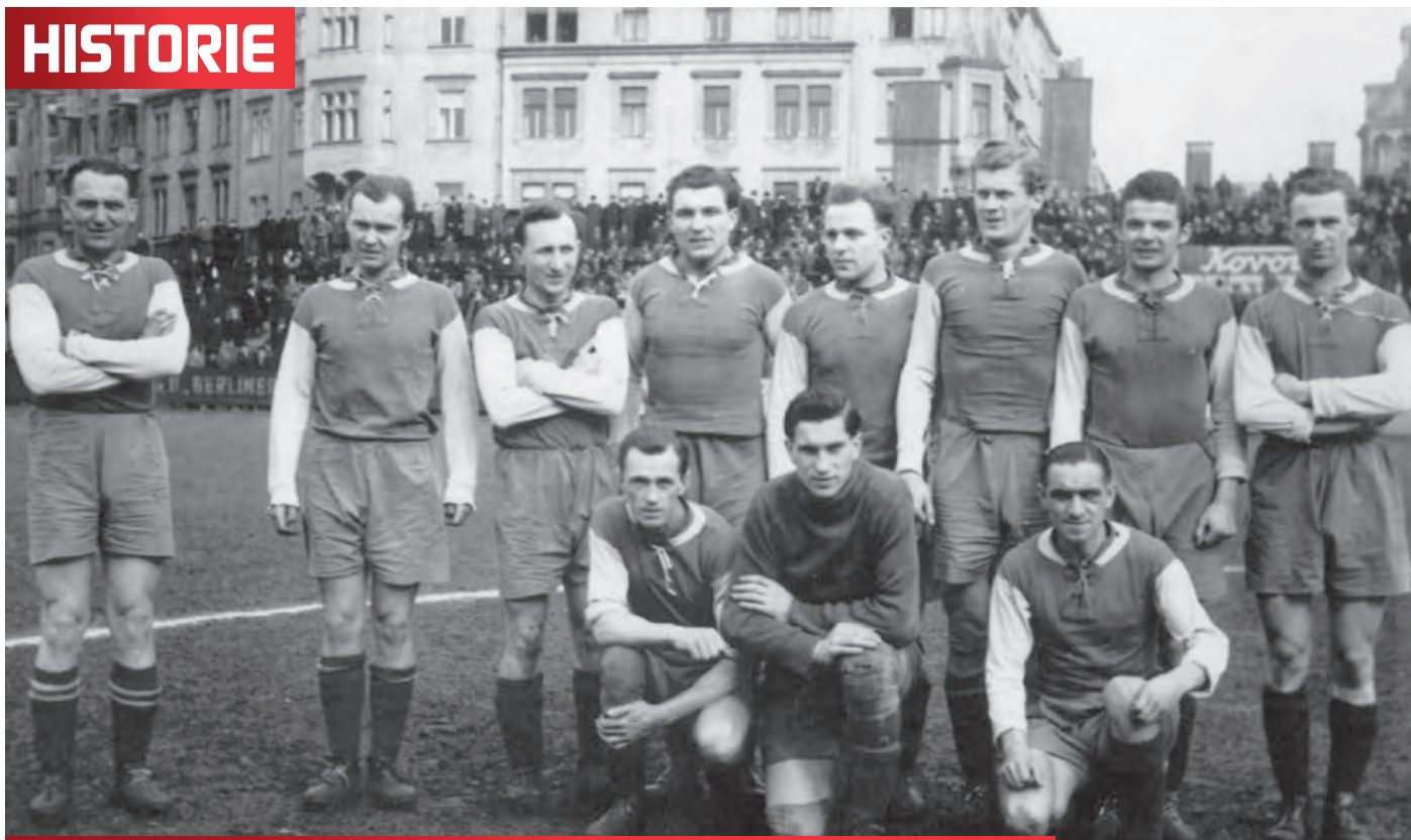
Modrobílý tým SK Nusle – jediný vítěz středočeské divize, který prvenstvím nezúročil ligové zkušenosti.