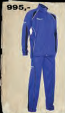
ROXE - 943