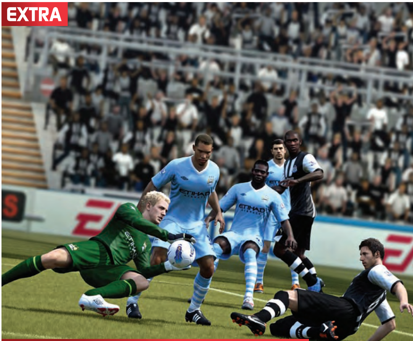
Situace z vápná nápadně připomínají skutečný fotbal.