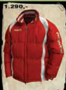
SPARTA - 83