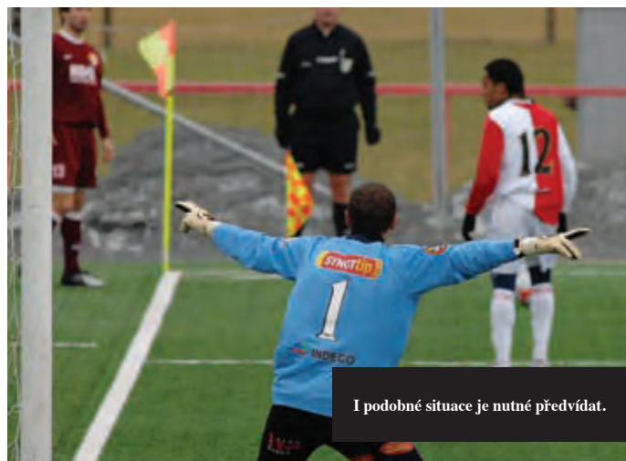
I podobné situace je nutné předvídat.