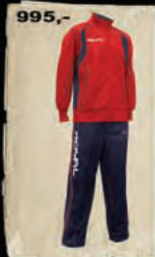
ADHARA - 48