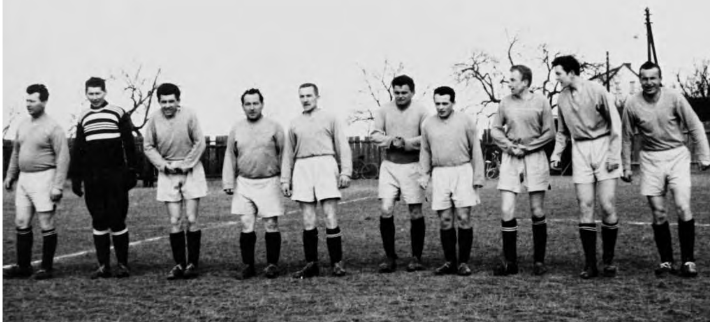
Historie dubečského klubu se začala psát v roce 1929.