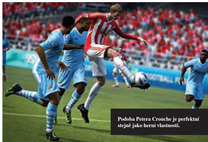
Podoba Petera Crouche je perfektní stejně jako herní vlastnosti.