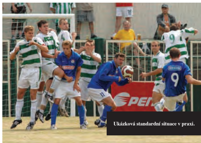
Ukázková standardní situace v praxi.

Ano, jsem v tomto případě zastáncem jistého stereotypu. V průběhu své trenérské kariéry jsem se naučil být trpělivým, takže role a postavení hráčů neměním po prvním nepovedeném utkání, kdy se hráči neprosadí. Uměním je rozpoznat, kdy je potřeba zasáhnout.